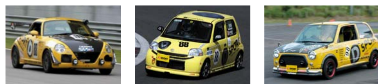
「K4-GPセ/バン24時間耐久エコランレース」 2009年 クラス2位/コペン 「K4-GP富士1000km耐久エコランレース」 2006年、2007年 クラス優勝/エッセ 「ダイハツ/チャレンジカップ」/ミラ ジーン

D-SPORTは、モータースポーツにも積極的に挑戦を続けています。ジムカーナの「ダイハツ・チャレンジカップ」をはじめ、「K4-GP」などの耐久レースにエントリー。競技車には走行性能、耐久性、信頼性において、当然レーシングスベックが求められますが、これらの競技は、いずれも大幅な改造が許されず、車両の基本性能と、公道走行可能な市販パーツの性能の高さが非常に重要なウエイトを占めます。D-SPORTでは、競技車両に市販製品を装着し、その性能と信頼性の高さを実証するとともに、レースで得たノウハウを製品開発に活かしています。